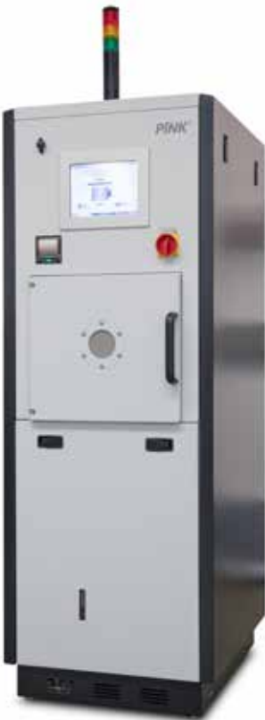
Die Anlage V55-GKM ist u.a. für die Plasma-Aktivierung von medizintechnischen Komponenten ausgelegt.