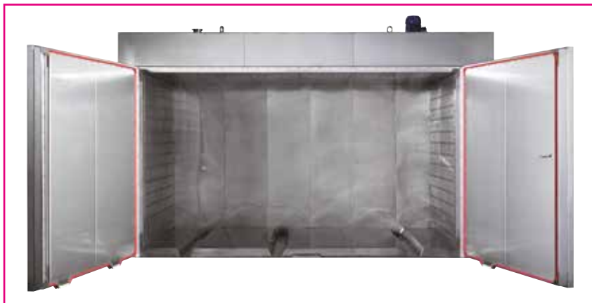
Umluft-Ofen Typ UT 3400-1800-1900 mit doppelflügeligen Türen und versenkten Bodenschienen zum ebenerdigen Befahren.

Die Angaben und Abbildungen in diesem Datenblatt dienen als Orientierungshilfe für die mögliche Ausführung Ihres maßgeschneiderten Trocknungssystems.