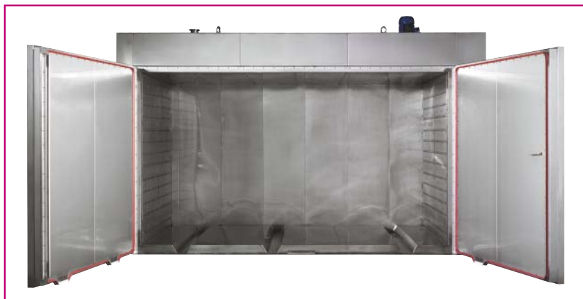
Umluft-Ofen Typ UT 3400-1800-1900 mit doppelflügeligen Türen und versenkten Bodenschienen zum ebenerdigen Befahren.